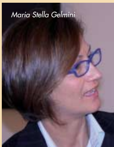
Maria Stella Gelmini