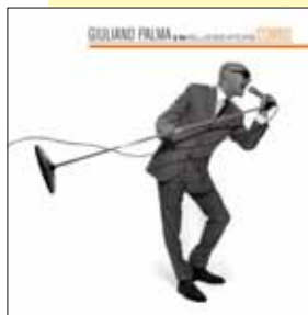
Giuliano Palma, The Bluebeaters COMBO (New Ed.) V2, 2010

Tre proposte per un'estate musicale. Le uniche nuvole che ci auguriamo sono quelle rosa di Giuliano Palma & The Bluebeaters, accompagnati dalla meravigliosa voce black di Melanie Fiona (per chi non lo sapesse, la protagonista del tormentone 2009 Give it to me right). Il singolo ha anticipato la nuova versione dell'album Combo e un tour per l'Italia. Sfumature soul per un brano che sta già spopolando. Altrettanto successo, e non Imprevedibile, per il singolo di Paolo Meneguzzi tratto da Miami. Amore e sensualità (e un video che alcuni definiscono ai limiti del hot) per il cantante "varesino", che, un po' snobbato dalla critica, non sbaglia un colpo: un album più maturo, testi compresi, che piacerà anche ai "grandi". Un consiglio più classico è, invece, l'elegante cofanetto dedicato a Robert Schumann, per commemorare l'anniversario di 200 anni dalla nascita. 25 cd per un lavoro senza precedenti. Con la partecipazione di celebri artisti, tra cui Uto Ughi. Un must per i patiti del compositore e musicista tedesco, tra i più illustri rappresentanti della musica "romantica".