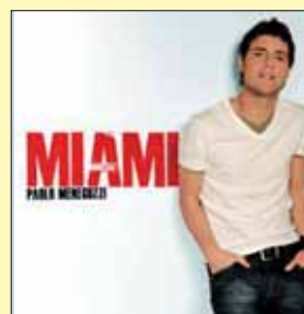
Paolo Meneguzzi MIAMI Around the Music, 2010