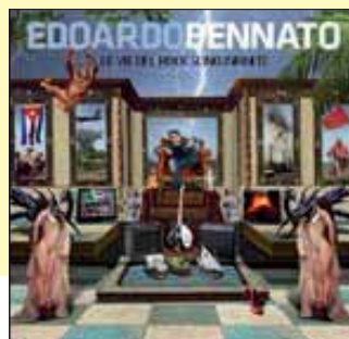
Edoardo Bennato LE VIE DEL ROCK SONO INFINITE Universal, 2010