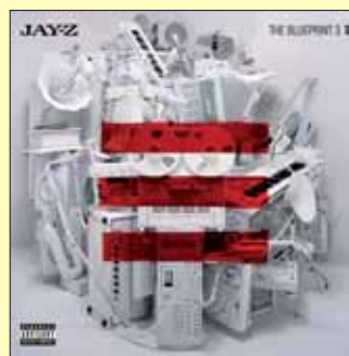
Jay-Z THE BLUEPRINT 3 Rock Nation 2009