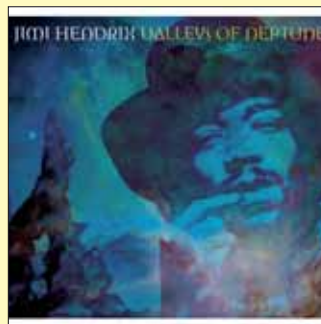
Jimi Hendrix VALLEYS OF NEPTUNE Columbia 2010