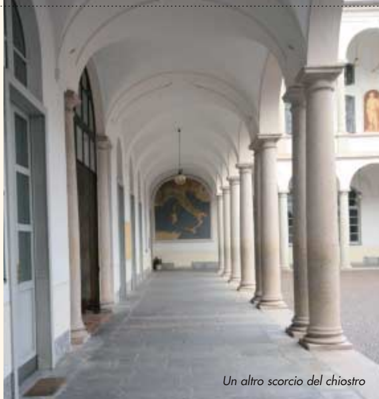
Un altro scorcio del chiostro