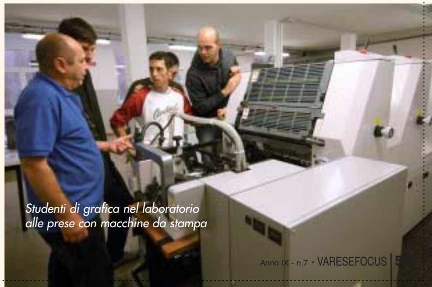
Studenti di grafica nel laboratorio alle prese con macchine da stampa