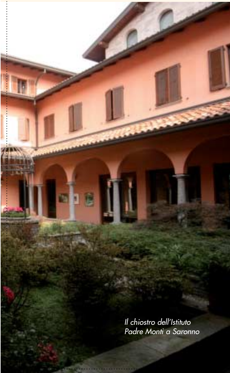
Il chiostro dell'Istituto Padre Monti a Saronno

La formazione dei giovani è gestita invece dall'Associazione Padre Monti, facente parte dell'omonimo Istituto, continuando in questo modo l'attività svolta dalla congregazione religiosa. L'attenzione alla crescita e alla formazione della persona è l'elemento trainante di tutte le iniziative organizzate da questo Istituto. Il Centro di Formazione Professionale propone dal 1972 corsi professionali nell'ambito della poligrafia e della multimedialità; gli obiettivi principali di tali corsi sono l'inserimento lavorativo nel settore grafico e della stampa e la rimotivazione verso ulteriori percorsi di specializzazione e di studio.